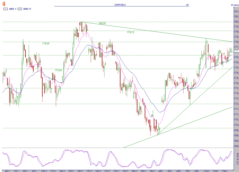
GRÁFICO CAFÉ MARÇO BM&F (ICFH10)