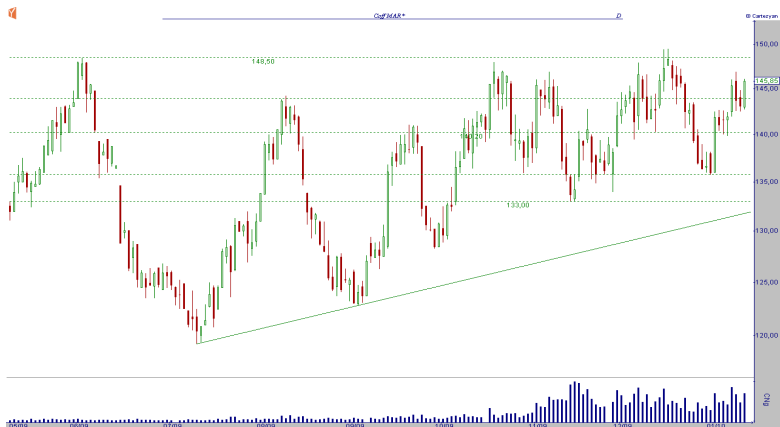
GRÁFICO CAFÉ MARÇO NY (CFNH10)